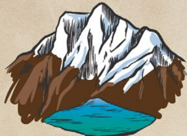
Nevado Humantay 5,950m / 19,521ft