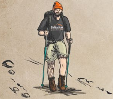
Cusco 3,400m / 11,155ft