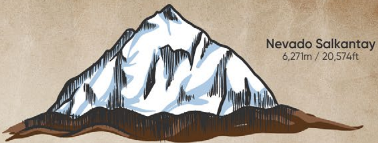
Nevado Salkantay 6,271m / 20,574ft