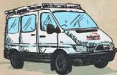
Cusco 3,400m / 11,155ft