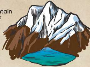
2.5km - 1.55mi | 1:30hrs Humantay Lake 4,200m / 13,780ft