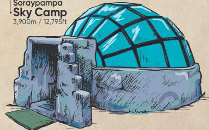
7km - 4.35mi | 3hrs Soraypampa Sky Camp 3,900m / 12,795ft